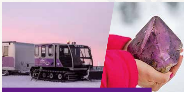
紫水晶礦場 Amethyst Mine

總面積約13000-20000平方米。在零下5度的冰雪城堡內觀賞每年不同的大型冰雕展覽，設有冰雪酒店、冰雪教堂、餐廳與酒吧，享受獨一無二的冰雪體驗。