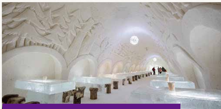
冰雪城堡 Snow Castle

總面積約13000-20000平方米。在零下5度的冰雪城堡內觀賞每年不同的大型冰雕展覽，設有冰雪酒店、冰雪教堂、餐廳與酒吧，享受獨一無二的冰雪體驗。