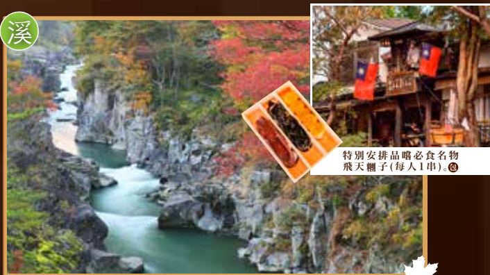
特別安排品嚐必食名物 飛天團子(每人1串)。◎