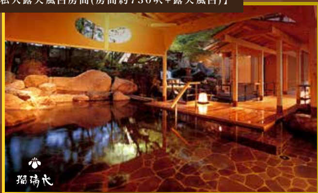
↑【可每位每晚HK$1000提升「藤之棟」私人露天風呂房間(房間約834呎+露天風呂)】(房間非溫泉水)