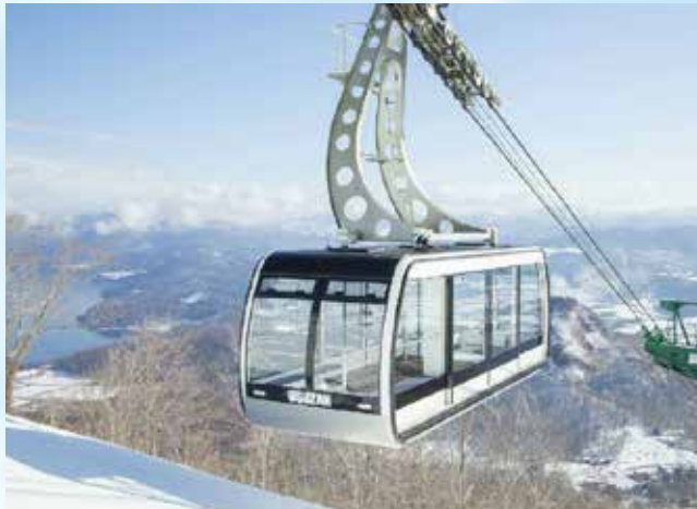
〔有珠山纜車〕空中散歩

船上からは洞爺の壮大な自然の風景を思う存分楽しむことができます。羊蹄山、昭和新山、有珠山など、洞爺の壮大な自然が広がっており、湖の水は澄み切って底が見えます。景色は壮大で魅力的です。