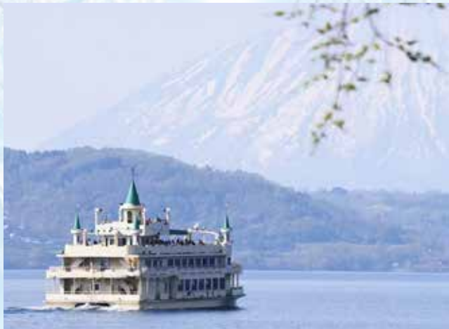
〔洞爺湖遊覽船〕約50分鐘