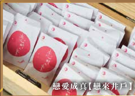
戀愛成真【戀來井戶】

玉造溫泉街非常鼓勵溫泉客穿着浴衣在溫泉街上散步。行程中所安排之3間溫泉旅館可以約500-1000日圓租借。穿上浴衣，讓你更能享受溫泉的樂趣。※部分酒店的顏色浴衣只提供女士及小朋友樣式