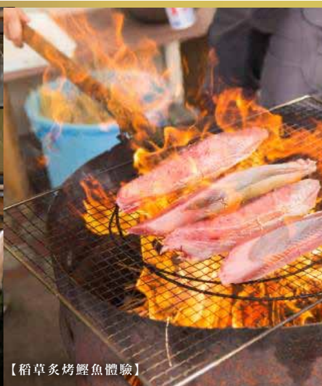
【稻草炙烤鰹魚體驗】