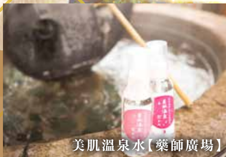
美肌溫泉水【藥師廣場】