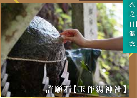
許願石【玉作湯神社】