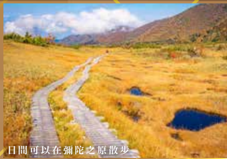
日間可以在彌陀之原散步