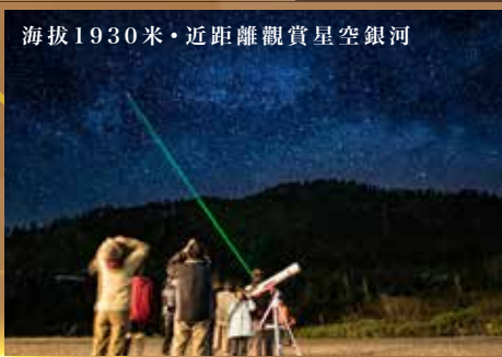
海拔1930米・近距離觀賞星空銀河