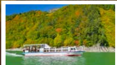
【黒部湖遊覧船】約30分鐘，近距離360°全景觀賞黒部水庫群山美景。

立山黑部是日本最早紅葉變色的地區之一，位於高海拔的紅葉會率先變紅，由山頂至山腳漸漸變色。