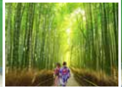
可自由前往竹林小路

京都嵐山腳下緩緩流淌的大堰川上橫跨一座橋，名為渡月橋，據說是因形似彎彎的月亮跨在河水上一樣而得名。橋墩用鋼筋建造，而橋面則為木造，古香古色，與周圍嵐山遊覽區的自然景觀和諧融洽。