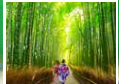
可自由前往竹林小路

京都嵐山腳下緩緩流淌的大堰川上橫跨一座橋，名為渡月橋，據說是因形似彎彎的月亮跨在河水上一樣而得此名。橋墩用鋼筋建造，而橋面則為木造，古香古色，與周圍嵐山遊覽區的自然景觀諧和融洽。