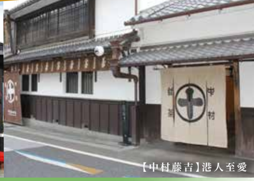
【中村藤吉】港人至愛