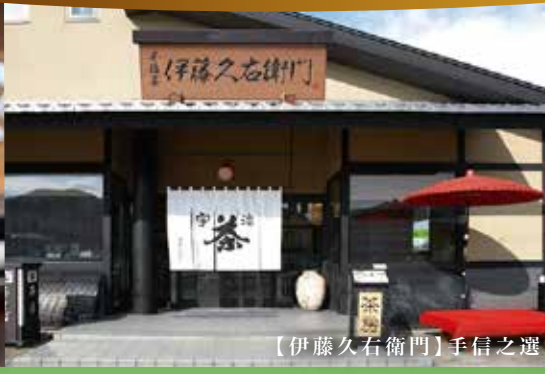
【伊藤久右衛門】手信之選