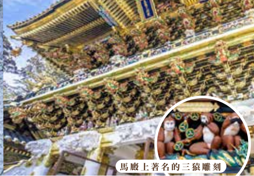
馬廐上著名的三猿雕刻