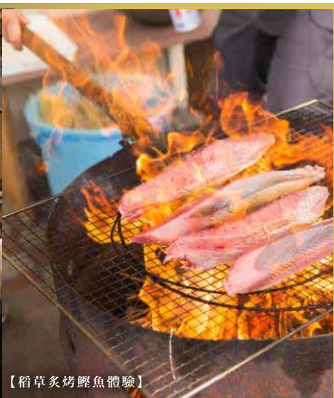
【稻草炙烤鯉魚體驗】