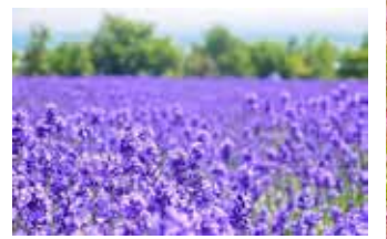
10月上旬起賞紫色鼠尾草

淡路島全年溫暖少雨，擁有「花之島」的美譽。淡路花卉山丘位於淡路島北部丘陵地區頂部，是一片從山丘向大海延伸的花海。從木製展望台可看到一望無際的花田外，同時欣賞明石海峽、大阪灣全景風光。