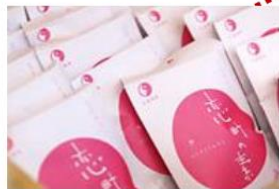
- 戀來井戶 -

可以在廣場裡的小箱購買空樽(約 200 円), 裝下旁邊一直湧出的源泉 100% 的美肌溫泉水, 帶回家作爽膚水使用。 ※保質期為 5 天