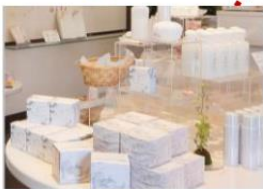
- 姬 LABO -