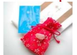
- 玉作湯神社 -

一條通紅的橋。據說從橋上拍到的照片可以照到玉作湯神社的鳥居, 就可以增強戀愛運。