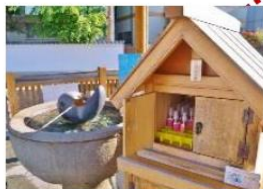
- 湯藥師廣場 -

可以在廣場裡的小箱購買空樽(約 200 円), 裝下旁邊一直湧出的源泉 100% 的美肌溫泉水, 帶回家作爽膚水使用。 ※保質期為 5 天