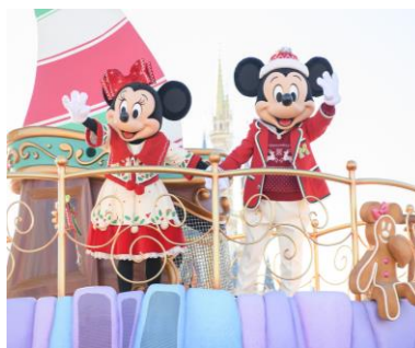
東京ディズニーリゾート®アプリ、登場！

自行領取 40 週年優先入場卡或購買尊享卡，節省排隊等候時間。下載並打開東京迪士尼官方應用程式，點選 My Plan 的 Tokyo Disney Resort 40th Anniversary Priority Pass。然後選擇希望取得 40 週年優先入場卡的園區票券。接著點選體驗設施欄位內標有時段的按鈕。做最終確認後，點選 Issue。優先入場卡的指定時段將顯示於應用程式的 My Plan。亦可在官方應用程式的 Disney Premier Access 購買尊享卡。詳情請瀏覽 https://www.tokyo-disneyresort.jp/tc/tdr/app.html