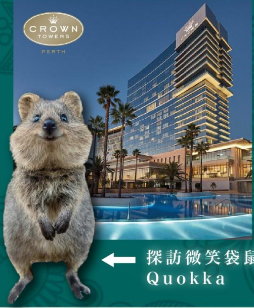
← 探訪微笑袋鼠 Quokka

[8天] [國泰直航] 西澳珀斯. 飛機遊粉紅湖. 5星瑪格麗特酒莊之旅. 提升珀斯5星Crown Towers & Pullman Bunkers Bay 400陽台房間. 西澳岩龍蝦. 即捕即食龍蝦海鮮盛宴