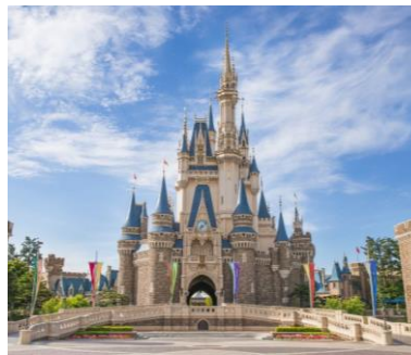
東京ディズニーリゾート®・アプリ、登場!

詳情請瀏覽 https://www.tokyodisneyresort.jp/tc/tdr/app.html