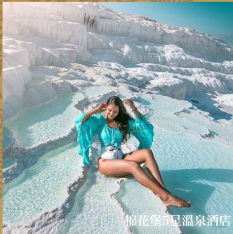
棉花堡5星溫泉酒店