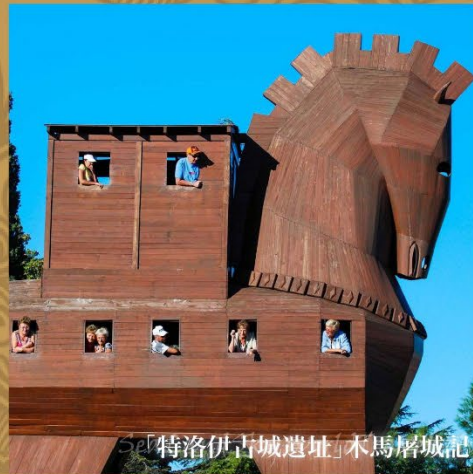
「特洛伊古城遺址」木馬屠城記