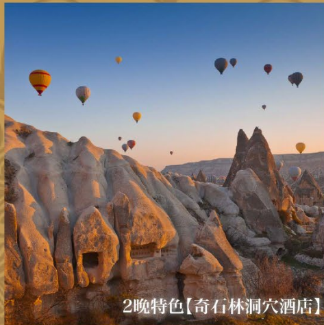
2晚特色【奇石林洞穴酒店】