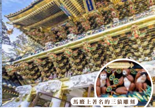
馬廐上著名的三猿雕刻