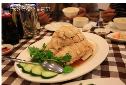
米芝蓮推介文東記