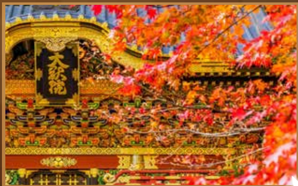
【日光東照宮】世界文化遺產・紅葉百選

日本奈良時期末期由中國唐僧玄奘三藏的第一位日本弟子慈恩大師開創於778年。清水寺的山號為音羽山，主要供奉千手觀音。大殿前懸空的「舞台」，由139根高數十公尺的大圓木支撐。經過3年整修，本堂屋頂煥然一新，強勢回歸。