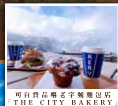
可自費品嚐老字號麵包店「THE CITY BAKERY」

位於富山縣以西的北阿爾卑斯山脈，擁有風光如畫的大自然，是日本三大險峻山脈之一。用6種不同的交通工具橫跨穿越，包括登山纜車、高原巴士、無軌電車、空中纜車等，其中立山空中纜車是日本第一長的無支柱空中纜車，長約1700米，途中並沒有任何支柱支撐，可以360度無限欣賞立山黑部的壯麗景色，更被稱為「移動的空中展望台」！