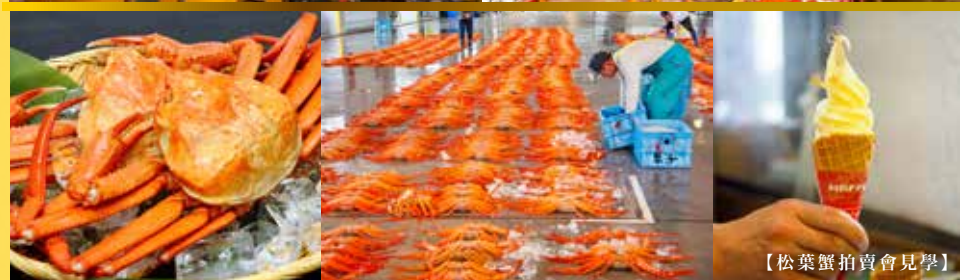
【松葉蟹拍賣會見學】

津輕藩睡魔村為模擬體驗弘前睡魔祭的觀光設施。館內展出弘前睡魔燈籠及民間工藝品，可了解弘前燈籠節的發展過程，當中甚至有高達10米的超大型花燈。此外這裡更可以欣賞到民族樂器「津輕三味線」現場演奏。