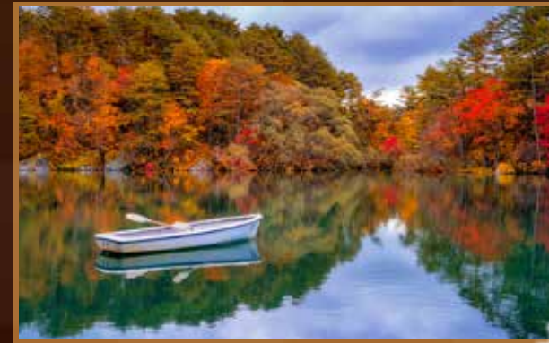
【五色沼】日本九寨溝

京都嵐山腳下緩緩流淌的大堰川上橫跨一座橋，名為【渡月橋】，據說是因形似彎彎的月亮跨在河水上一樣而得名。橋墩用鋼筋建造，而橋面則為木造，古香古色。