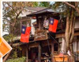
特別安排品嚐必食名物 飛天團子(每人1串)。