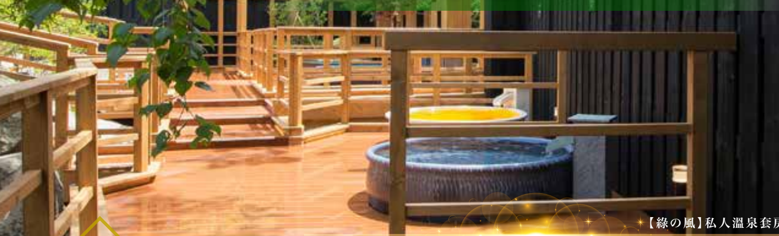
【綠の風】私人溫泉套房

酒店內設有多種溫泉設施，泉質為單純泉。在北湯澤豐富的自然景觀包圍中，靜靜的享受浸泡溫泉帶來的舒適。和洋室面積約400呎，寬敞舒適，明亮的设计更彰顯嫺靜的氛圍，安心舒緩旅途疲勞。