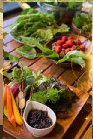
*當日之菜單由店家因應當天的食材為您精心烹調，圖片僅供參考