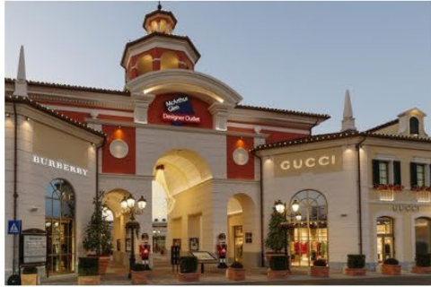
米蘭塞拉瓦萊名品購物村 Serravalle Designer Outlet

被譽為歐洲最大名牌折扣Outlet 有超過 230 名店進駐，知名品牌 Prada、D&G、Gucci、Armani、Bulgari、Burberry 都可找到。