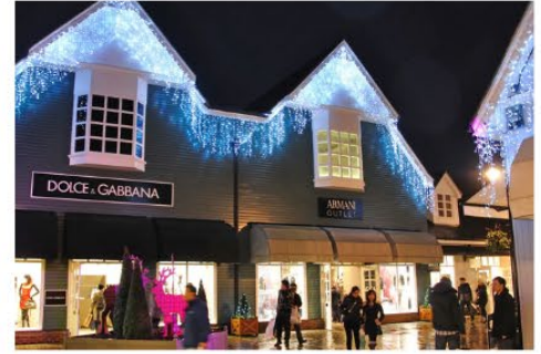
倫敦比斯特購物村 Bicester Village Outlet

擁有 120 多家來自法國和國際最令人興奮的設計師的精品店，全年都以令人難以抗拒的價格出售較前系列的產品。