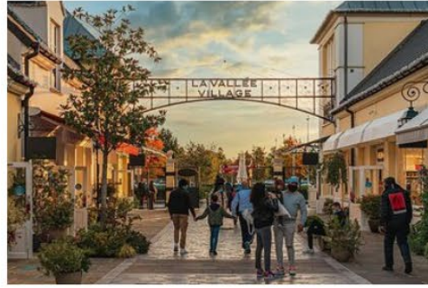
巴黎河谷購物村 La Vallee Outlet

被譽為歐洲最大名牌折扣Outlet 有超過 230 名店進駐，知名品牌 Prada、D&G、Gucci、Armani、Bulgari、Burberry 都可找到。