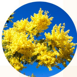
金合歡 Golden Wattle

花語：隱藏在心中的愛 紙雛菊源主要生長於西澳南部半乾旱地區，粉紅色、黃色和白色的花朵聚在一起成為一片花海，特別好看。