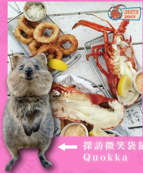
← 探訪微笑袋鼠 Quokka

[8天][國泰直航]西澳珀斯.海陸空粉紅湖雙體驗. 瑪格麗特河酒莊之旅.嚴選5星PULLMAN400呎獨立VILLA. ↑ 提升珀斯頂級CROWN TOWERS