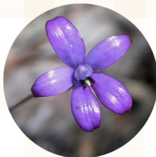
紫瑯蘭 Enamel Orchid

花語：勇敢而堅強 班克木是為了紀念「澳洲植物之父」Joseph Banks而命名的。全世界有173種班克木，其中有172種在澳洲。