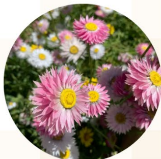
紙雛菊 Rosy sunray

花語：隱藏在心中的愛 紙雛菊源主要生長於西澳南部半乾旱地區，粉紅色、黃色和白色的花朵聚在一起成為一片花海，特別好看。