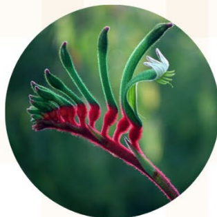
袋鼠爪 Kangaroo Paw

花語：恩賜與回憶 大果桉樹具有光滑、閃亮的樹皮，呈短絲帶狀和彷彿帶著銀色粉末的大片葉子，花朵是所有桉樹中最大的。