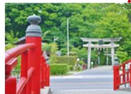
- 宮橋 -

日文中鯉魚與戀愛同音。傳說把魚糰 (約 100 円) 投進井旁的河溪, 如果有鯉魚出現, 代表戀愛能夠成真。