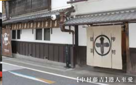
【中村藤吉】港人至愛