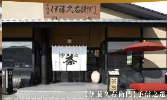
【伊藤久右衛門】手信之選