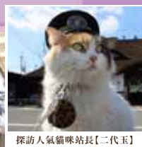
探訪人氣貓咪站長【二代玉】

和歌山最著名的貴志川線，人們爭相探訪的人氣偶像（貴志站小玉貓咪站長）。悉心安排包乘坐特色火車，可愛有趣的車廂設計令人樂而忘返。由貴志站前往伊太祈曾站，共5個車站，車程約12分鐘。