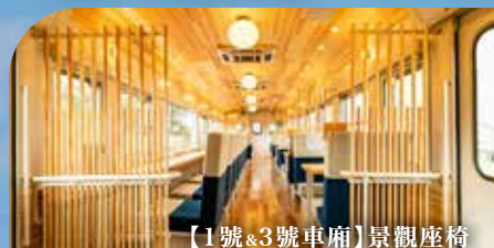
【1號&3號車廂】景觀座椅