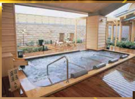
↑ 可以每位HK$1500提升「松屋千千」私人露天風呂房間