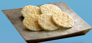
土特產：白蝦紀行煎餅

一大特色是在設有現場調理料理的開放式廚房，嚴選來自富山灣時令食材，即場製作富山灣壽司、海鮮小菜及茶碗蒸，以舌尖細細品嚐富山大自然的肥沃豐饒。