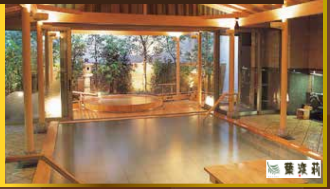
↑【可以每位HK$1000提升「藤之棟」私人露天風呂房間(房間約834呎+露天風呂)】(房間非溫泉水)