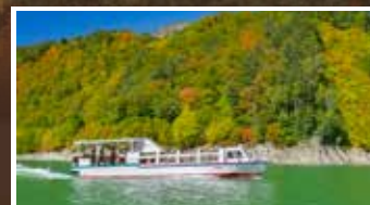
【黒部湖遊覧船】約30分鐘，近距離360°全景觀賞黒部水庫群山美景。

立山黑部是日本最早紅葉變色的地區之一，位於高海拔的紅葉會率先變紅，由山頂至山腳漸漸變色。