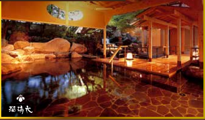
↑【可以每位HK$1000提升瑠璃光「星之棟」私人露天風呂房間(房間約730呎+露天風呂)】

松屋千千私人露天風呂房間，皆備有源泉露天浴池，呈現高雅質感，寫意悠閒的氛圍。高雅舒適的空間，療癒您身心的上等隱居處。盡情享受奢華的大人度假時光。