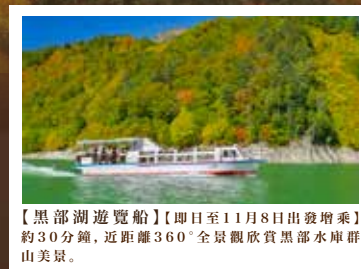
【黒部湖遊覧船】【即日至11月8日出發增乘】約30分鐘，近距離360°全景觀欣賞黒部水庫群山美景。

立山黑部是日本最早紅葉變色的地區之一，位於高海拔的紅葉會率先變紅，由山頂至山腳漸漸變色。