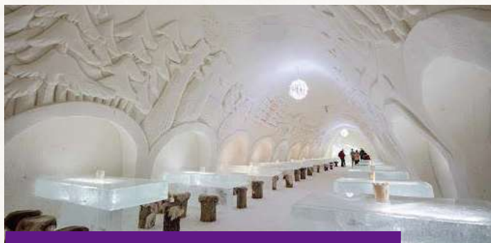
冰雪城堡 Snow Castle

總面積約13000-20000平方米。在零下5度的冰雪城堡內觀賞每年不同的大型冰雕展覽，設有冰雪酒店、冰雪教堂、餐廳與酒吧，享受獨一無二的冰雪體驗。