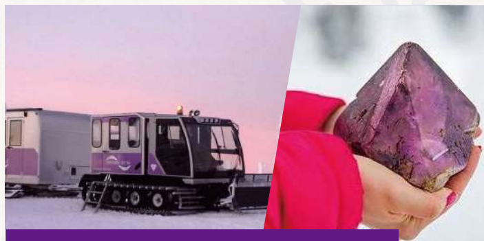
紫水晶礦場 Amethyst Mine

總面積約13000-20000平方米。在零下5度的冰雪城堡內觀賞每年不同的大型冰雕展覽，設有冰雪酒店、冰雪教堂、餐廳與酒吧，享受獨一無二的冰雪體驗。