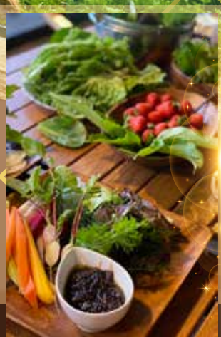
*當日之菜單由店家因應當天的食材為您精心烹調，圖片僅供參考