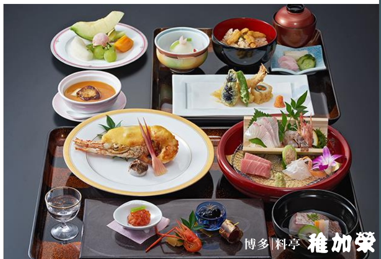
博多 | 料亭 稚加榮