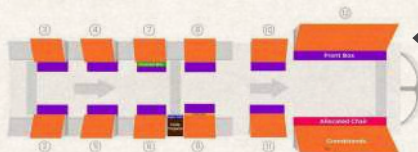
Front Box (6人專屬包廂)

特別安排 Front Box 6人專屬包廂欣賞嘉年華巡遊，坐位區位於賽道2則，以最近距離與表演者見面，其位置感及視野極佳，可輕鬆打卡拍照或跟隨節奏熱舞。