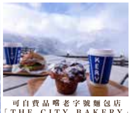
可自費品嚐老字號麵包店「THE CITY BAKERY」