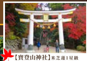
【寶登山神社】米芝蓮1星級

在標高1,289米的山頂之上，設施的戶外平台是能將北阿爾卑斯山雄偉山景盡收眼底的話題露天咖啡。設施內還有創業於1990年來自紐約的老字號麵包店THE CITY BAKERY。