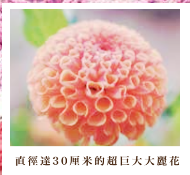
直徑達30厘米的超巨大大麗花