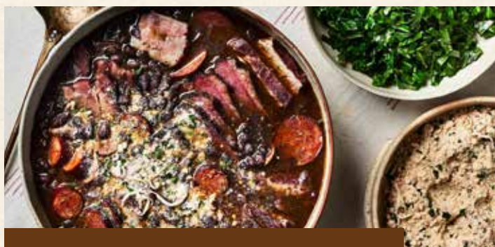
巴西國菜Feijoada【黑豆燉肉】

The Ritz Carlton Hotel Santiago is located in Santiago. The international 5-star brand hotel attracts many tourists to stay. The rooms are approximately 430 square feet in size and all provide free Wi-Fi. Each room is also equipped with a minibar, independent temperature control system, flat-screen TV (can watch international channels), refrigerator, and bathroom with hairdryer, bathrobe and slippers.