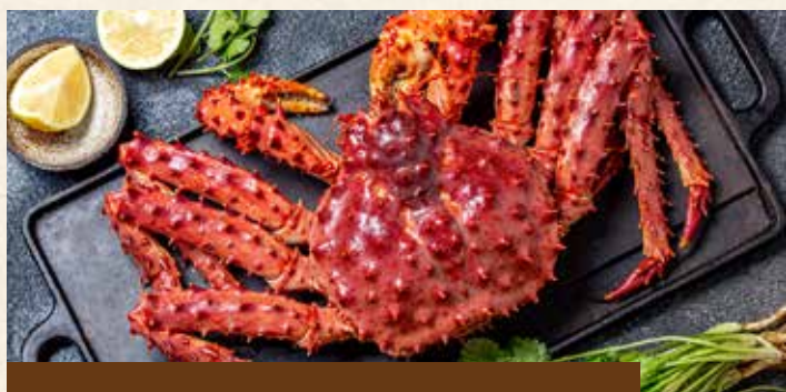
智利西式帝王蟹料理Chile King Crab

The Westin Lima Hotel in Lima has complete five-star facilities, including a half-Olympic-sized indoor swimming pool, 2 restaurants, a spa center, etc., as well as panoramic views of Lima. Rooms offer a flat-screen satellite TV, minibar, in-room safe, coffee maker and city views.