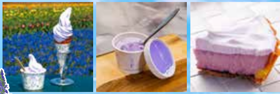
可自行購買必嗜薰衣草製甜品