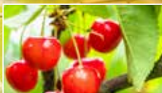
車厘子 7月上旬至7月下旬