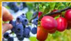
藍莓、布蘇 7月下旬至8月中旬