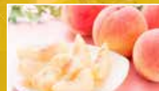
桃 8月中旬至9月中旬