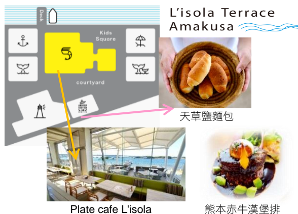
Plate cafe L'isola

人氣 TOP3 滋味推介：海鮮 Plate Lunch、熊本赤牛漢堡排、海鮮咖哩飯。此外，AMAKUSA SHIO-PAN LAB 出售用天草鹽製成的各式鹽麵包，可以當作下午茶。