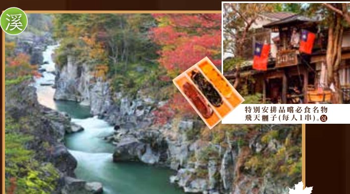
特別安排品嚐必食名物 飛天糰子(每人1串)。◎