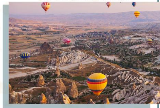
奇幻多變的岩峰地貌