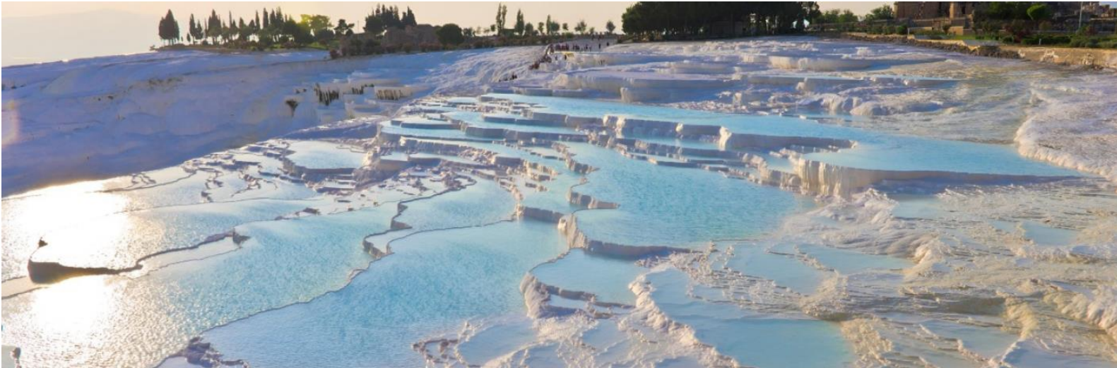
雪白連綿之水城堡