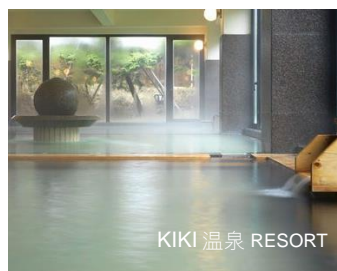
KIKI 溫泉 RESORT

www.shiretoko.co.jp / www.kikishiretoko.co.jp/