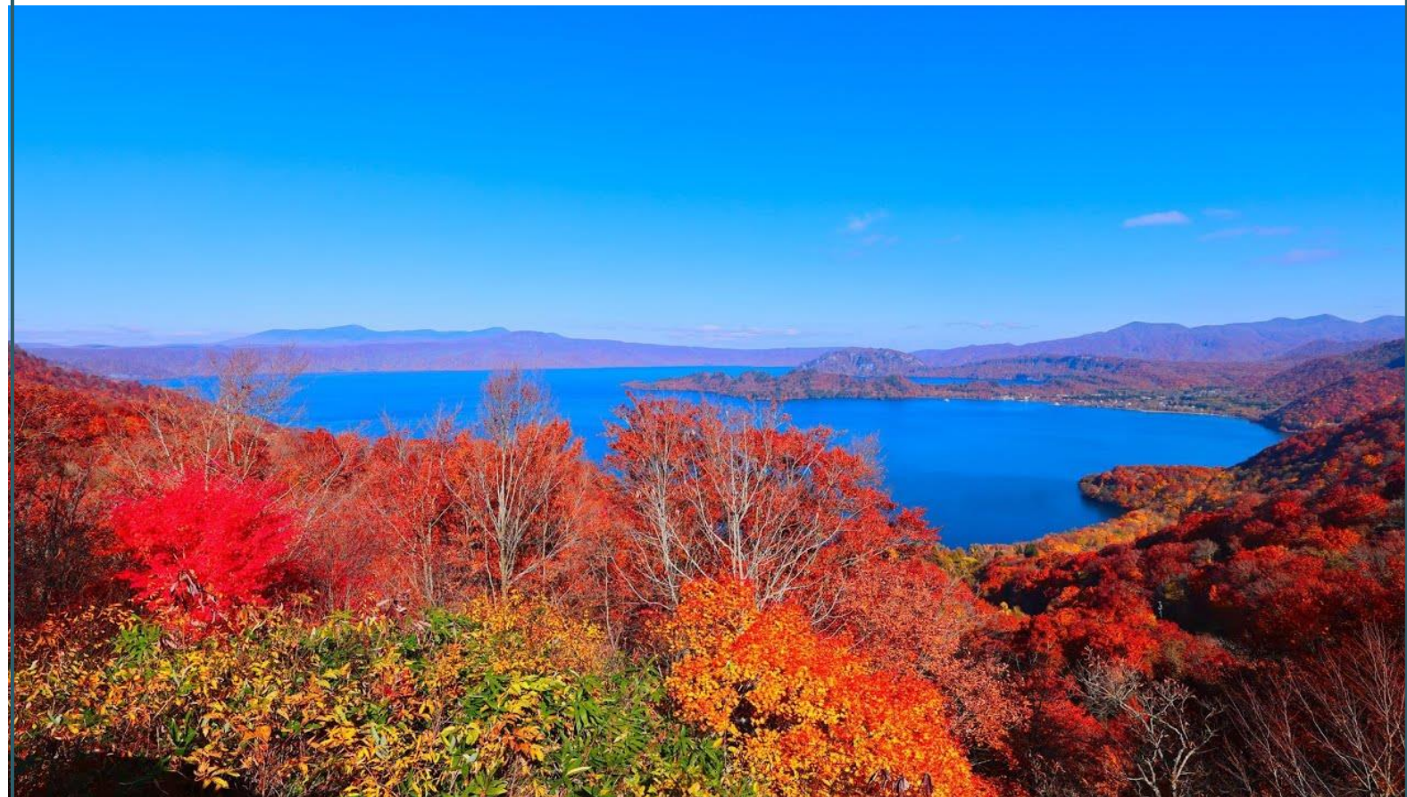
※ 航班編號、起飛及回程時間，最終以航空公司決定為準。