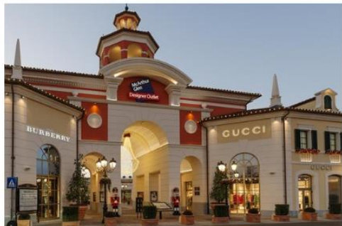
米蘭塞拉瓦萊名品購物村 Serravalle Designer Outlet

被譽為歐洲最大名牌折扣Outlet 有超過 230 名店進駐，知名品牌 Prada、D&G、Gucci、Armani、Bulgari、Burberry 都可找到。