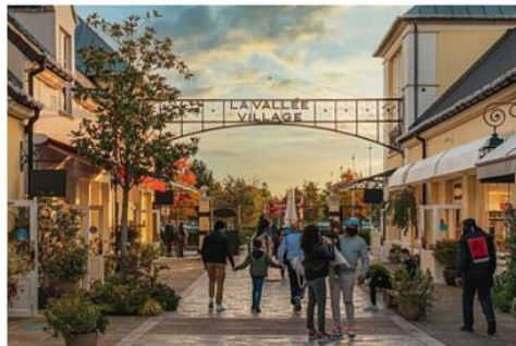
巴黎河谷購物村 La Vallee Outlet

被譽為歐洲最大名牌折扣Outlet 有超過 230 名店進駐，知名品牌 Prada、D&G、Gucci、Armani、Bulgari、Burberry 都可找到。