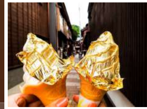
金澤名物【金箔雪糕】