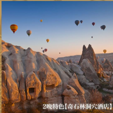
2晚特色【奇石林洞穴酒店】