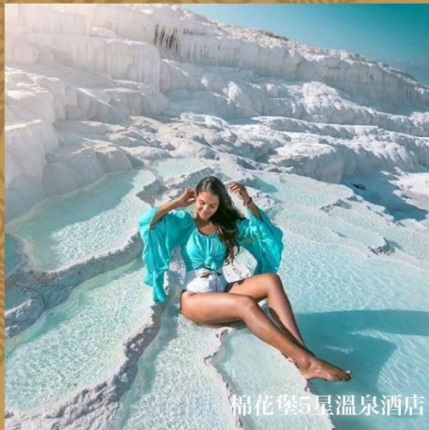
棉花堡5星溫泉酒店