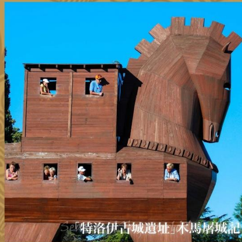
「特洛伊古城遺址」木馬屠城記