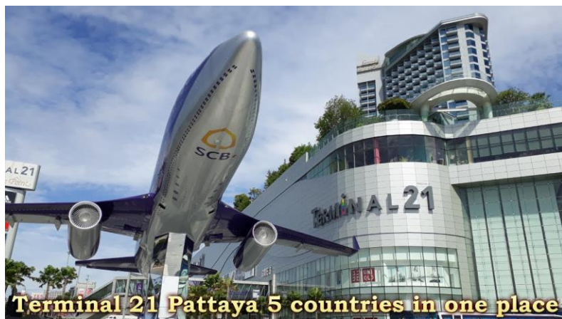
Terminal 21 Pattaya 5 countries in one place

[BIG C 超級廣場] 要搜羅超值的泰國食品和用品，BIG C 真的可能是大家最好的選擇了。超乎休想像的平價及齊備的款式，絕對係 best for shopping 呀！