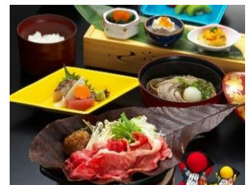
圖片只供參考實際菜單內容以餐廳為準

飛驒牛是岐阜縣的飛驒地方至少養育一年以上的黑毛和種牛，而且都是經過日本食肉格付協會嚴格篩選出來，飛驒牛更曾經於有「和牛界奧林匹克」之稱的「全國和牛能力共進會」贏得兩次最優秀賞的冠軍。飛驒牛香氣四溢，油花若霜，入口即溶，美味無窮。