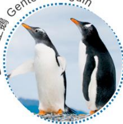
巴布亞企鵝 Gentoo Penguin

帽帶企鵝的樣子像一個頭戴黑帽的警官，帽子用一條頰帶綁緊在頭上。牠們面對走近牠們鳥巢的入侵者時，高冷的樣貌真的像正在驅逐入侵者的警察。亦因為牠們有這些特徵，牠們成為了最容易被辨認的企鵝之一。