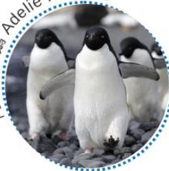
阿德利企鵝 Adelie Penguin

巴布亞企鵝是所有鳥類之中泳速最快的游泳高手，速度可達到每小時36公里。巴布亞企鵝會利用鳥巢盛載鳥蛋，因此雄性想要吸引雌性，就必須尋找最適合的築巢地點。牠們主要從四周環境收集石頭，或從其他巢中盜取回來，一個鳥巢可用上超過1700塊石頭來建成呢！