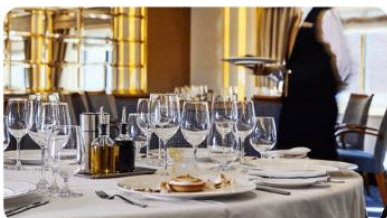
LA DAME RESTAURANT

GUESTS CAPACITY: 254 CREW CAPACITY: 212 BUILT: 1994 LAST REFURBISHMENT: 2017 TONNAGE: 17,400 TONS