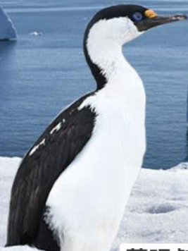
藍眼鸕鶿 IMPERIAL SHAG