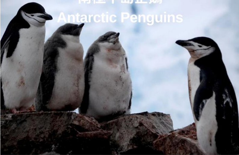
帽帶企鵝 Chinstrap Penguin