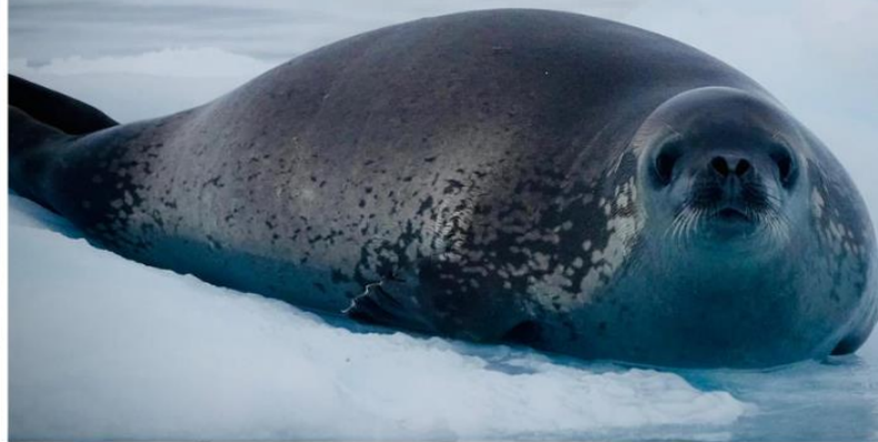
食蟹海豹 Crabeater Seal