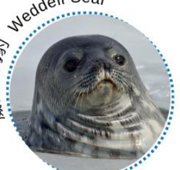
威德爾海豹 Weddell Seal

食蟹海豹是獨行動物，有時也會三兩成群，但不會出現企鵝般的大社群。牠們以磷蝦為主食，有時也會吃魚和魷魚，偏偏就是不食蟹！食蟹海豹在陸上看似笨拙，但在冰上牠們可以高達時速 25 公里滑動，到了水裡當然更揮灑自如了。