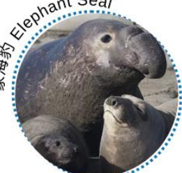
象海豹 Elephant Seal

威德爾海豹以固定的冰洞為家，冬季時仍會逗留在較南的水域，這時牠們會挖一個氣孔出入冰面和海底之間。牠們是獨行動物，但雌性在繁殖季節會成群地聚集，數量可多至 100 隻。威德爾海豹的食物以魚、魷魚和磷蝦為主，捕食時可潛到水深達 500 米的地方，維持 20 - 73 分鐘。