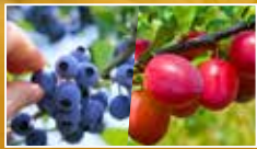
藍莓、布祿 7月下旬至8月中旬