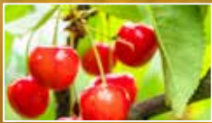
車厘子 7月上旬至7月下旬