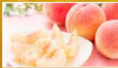
桃 8月中旬至9月中旬