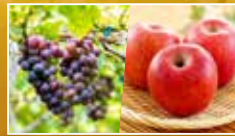
葡萄、蘋果 9月上旬至10月下旬

【7月1日起出發增遊】悉心安排於果園體驗採摘水果的樂趣，品嚐現摘新鮮、甘甜鮮美多汁的時令水果，可以盡情領略採摘水果體驗的魅力。