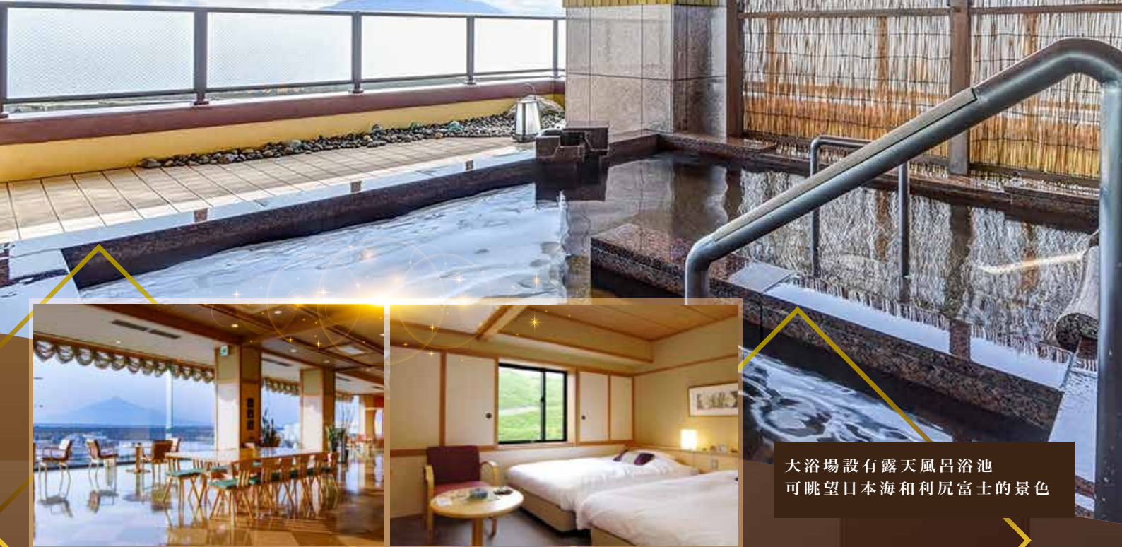
大浴場設有露天風呂浴池 可眺望日本海和利尻富士的景色

日本最北端的傳統日式旅館，放眼望去，部分客房可看到浮在海面、雄偉壯麗的利尻富士，讓隨季節變化的藍天大海景致與豐富的大自然，為旅途增寄添色彩。館內更附有大浴場和露天浴池，溫泉水都是從天然溫泉薄雪溫泉直接引來的。客人可望著浮在海上的利尻富士泡泡溫泉，即可解乏，放鬆身心。