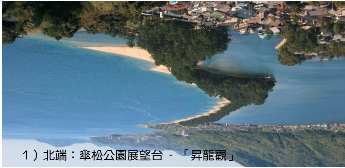
1) 北端：傘松公園展望台 - 「昇龍觀」