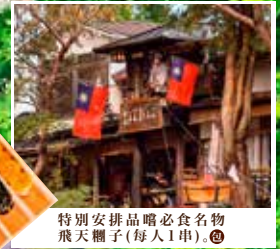
特別安排品嚐必食名物 飛天糰子(每人1串)。