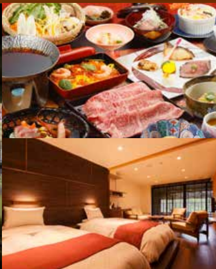
岩手鶯宿溫泉 長榮館