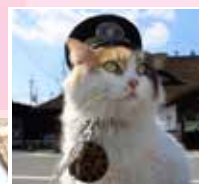
探訪人氣貓咪站長【二代玉】