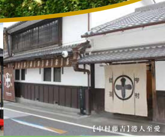
【中村藤吉】港人至愛